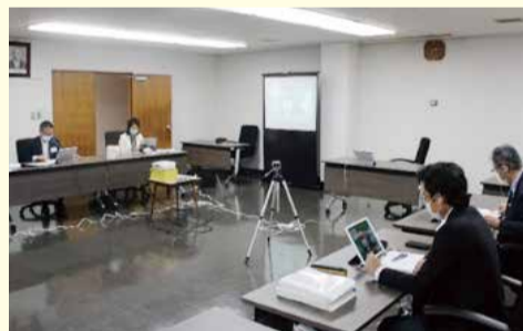
鎌倉市役所(オンライン)