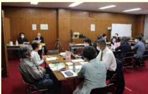
大船学習センター(対面)

令和3年(2021年)11月6日・7日に開催の議会報告会でテーマとした「鎌倉市の防災」について、参加した方々からご意見をいただきました。 市民環境常任委員会において、いただいたご意見を踏まえ政策化に向けた協議を行いました。 その結果、「防災に関する情報提供手段の拡充について」を議会からの政策提言として、7月4日に議長と委員長から市長へ提言書を提出しました。