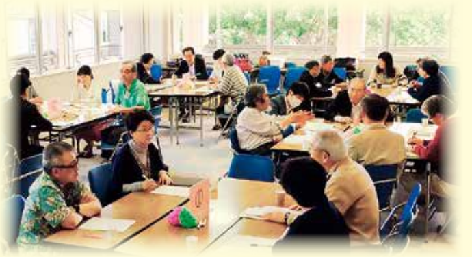
意見聴取会の様子（鎌倉武道館）

なお、いただいたご意見は、報告書にまとめ、市長へ参考送付しました。（内容は市議会ホームページにも掲載しています）