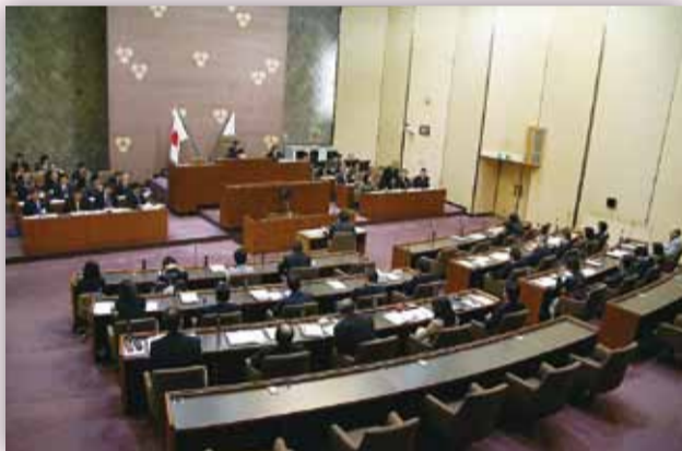
議場の議員・職員配置