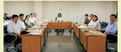
決算特別委員会の審査風景

予算特別委員会として、まとめられた意見は、委員長が本会議で報告し、その意見が予算執行においてどのように反映されているか、決算特別委員会で審査します。