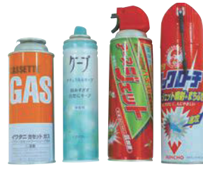
④スプレーカン、カセットボンベ