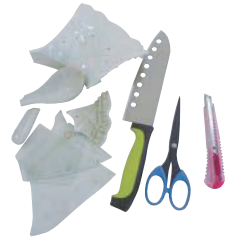
⑤割れたガラス製品 ・陶磁器・鏡、刃物類