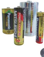
②乾電池 リチウムコイン電池

リチウムコイン電池（CR または BR 表記）はコインと同様の大きさです。小さいボタン電池の出し方は P30 を参照。