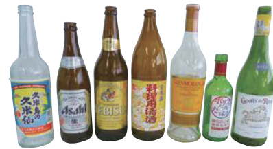
アルコール類のビン