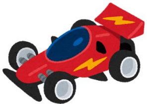
プラスチックのおもちゃ