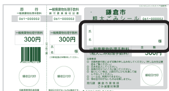
コンビニエンスストア取扱用