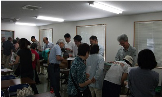
7月の展示説明会の様子