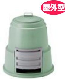
屋外型 コンポエース 120L 〈土の上に置くタイプ〉 (φ65×H69.2cm) 725 円 (税込)