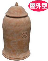
屋外型 素焼きコンポスト 〈土の上に置くタイプ〉 (φ45×H80cm) 2,500 円 (税込)