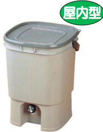
屋内型 BB スペシャル 〈台所などに置くタイプ〉 (W31×D30×H41cm) 373 円 (税込) 発酵促進剤 2 袋付