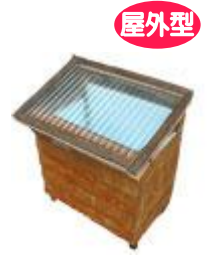
屋外型 ペランダ de キエーロ 〈ペランダ・軒先などに置くタイプ〉 (W90×D45×H80cm) 1,600 円 (税込) 黒土付

平成 24 年 8 月現在 機種及び価格につきましては、年度ごとに変わる可能性があります。