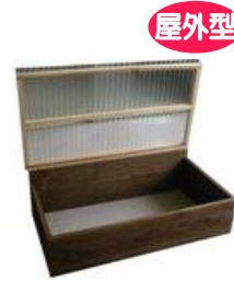
屋外型 バクテリア de キエーロ 〈土の上に置くタイプ〉 (W105×D57.5×H32cm) 1,200 円 (税込) 黒土付