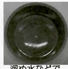
溜め水などで 洗えばきれいに！