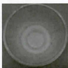
軽くゆすいで、 カスをとりましょう