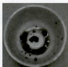
食べ終わった カップ麺の容器は…