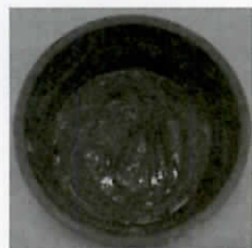
ヨーグルト容器も…