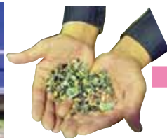
粉碎したものをペレットに加工します