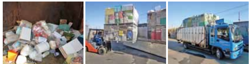
集められた製品プラスチックをコンテナに積んで、トラックで資源化先へ搬送します