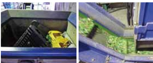
PPとPE等に分けた後、それぞれを破砕機にかけて、粉碎加工します