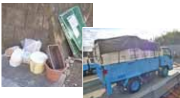
クリーンステーションに出された製品プラスチックを収集します