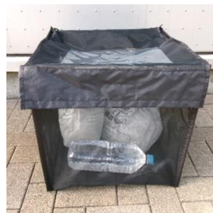
折り畳みボックス