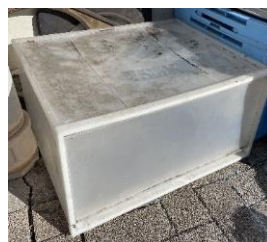
汚れや匂いの強いもの