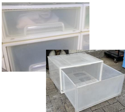
引き出しタイプの衣装ケース