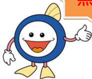
下水道マスコットキャラクター 「スイスイ」