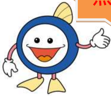
下水道マスコットキャラクター 「スイスイ」

下水処理場を探検しながら下水道のしくみを学びませんか。夏休みの自由研究にも活用できますよ！