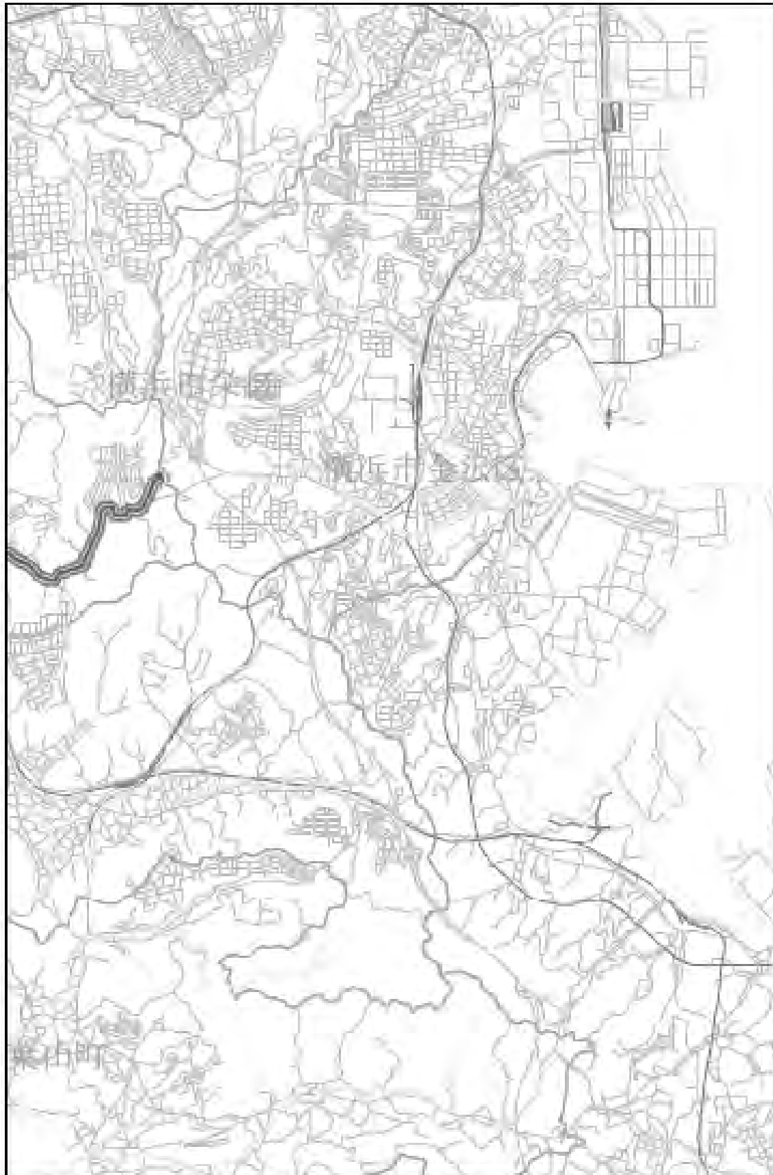
位置図（調査測定地点、評価区間） 縮尺率 1:50,000

この地図の作成にあたっては、国土地理院の承認を得て、同院発行の数値地図25000（空間データ基盤）を使用したものである。 （承認番号 平15地認授、第222号）