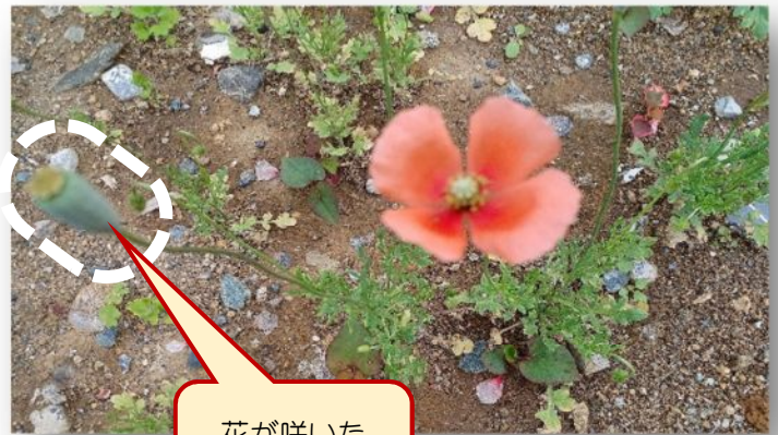
花が咲いた後にできた実