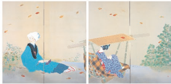
《桜もみぢ》昭和7年(1932)同館蔵