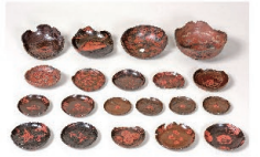
鎌倉出土漆絵碗・皿