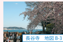
長谷寺 地図 B-3

鶴岡八幡宮の参道である段葛では300本の桜のトンネルが、境内では源平池のほとりに並ぶ桜が水面に映り込む美しい風景が見どころです。