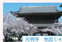
光明寺 地図 C-4