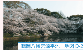
鶴岡八幡宮源平池 地図 D-2

鶴岡八幡宮の参道である段葛では300本の桜のトンネルが、境内では源平池のほとりに並ぶ桜が水面に映り込む美しい風景が見どころです。