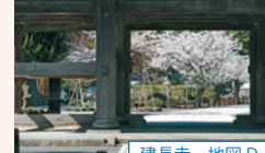
建長寺 地図 D-1