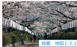
段葛 地図 C-3-2

鎌倉の桜の見頃は例年、3月下旬から4月上旬です。桜の定番スポットは数多くありますが、鎌倉の魅力は歴史を感じる空間ならではの風情の中でお花見を楽しめるところです。ぜひ、足を運ぶてください!