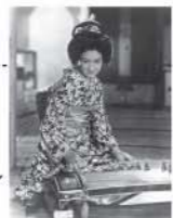
映画「新しき土」原節子さん直筆サイン入りポスター

[一般]800円 [小・中学生]400円(入館料込) 10:30~(各作品初日のみ)/14:00~ 3日~5日 「お嬢さん乾杯」※全日程14:00~ 6日~8日 「めし」 10日~12日 「山の音」 13日~15日 「驟雨」 20日~22日 「忠臣蔵 花の巻・雪の巻」※全日程13:00~ 月曜日(祝日は開館し、翌平日を休館)、年末年始(12月29日~1月3日)