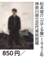
松本竣介立役者像 1947年

※鎌倉館 2016 10/17(土)~1/31(日) 鎌倉からはじまった。 1951-2016 PART3:1951-1965 「鎌倉近代美術館」誕生 【一般】1,000円 / [20歳未満と学生] 850円 / [高校生] 100円 / [65歳以上] 500円 ※中学生以下、障がい者手帳所有者は無料