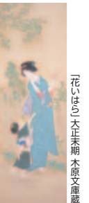
「花いははら」大正末期 木原文庫蔵

~10/18(日) 企画展「秋の情趣 清方の多彩な表現」 【一般】200円 / 【小・中学生】100円 ※市内在住の65歳以上の人、在住・在学の小学生は無料