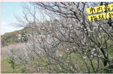
市内最大級の 梅林(約400本)