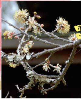
市天然記念物の 黄梅(本堂前)