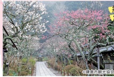
参道を彩る 約130本もの紅白梅