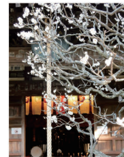
一本の木に 紅白咲き乱れる 「思いのまま」