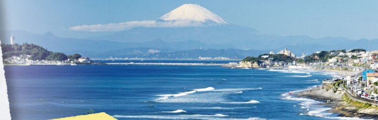
稲村ヶ崎からの展望