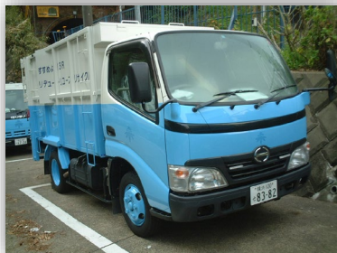
深ボディダンプ車 粗大ごみ・臨時ごみ等を収集します。