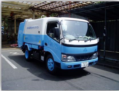
パッカー車 燃やすごみ等を収集します。