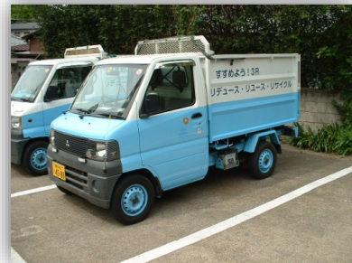
軽深ボディダンプ車 狭い道での収集で活躍しています。