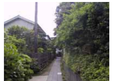
敷き際の美しい路地沿いの住宅