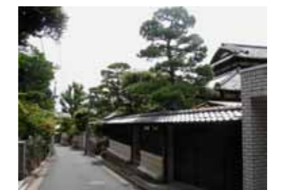
板塀を用いた住宅