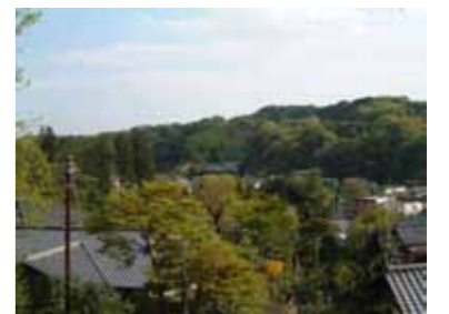
緑の中に見え隠れする谷戸の住宅地