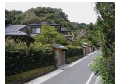
伝統的な素材を使用した住宅