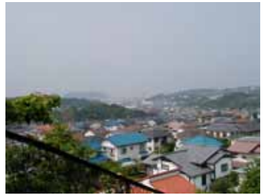
眺望点からの見え方に配慮したボリューム感