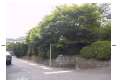
まちかどを特徴づけるシンボルツリー