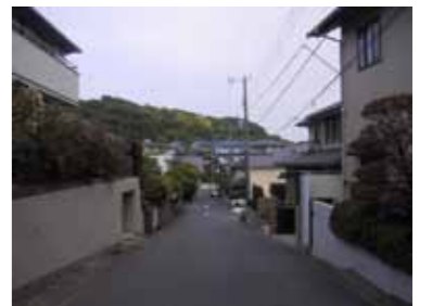
低層を基調とした落ち着いたまち並み