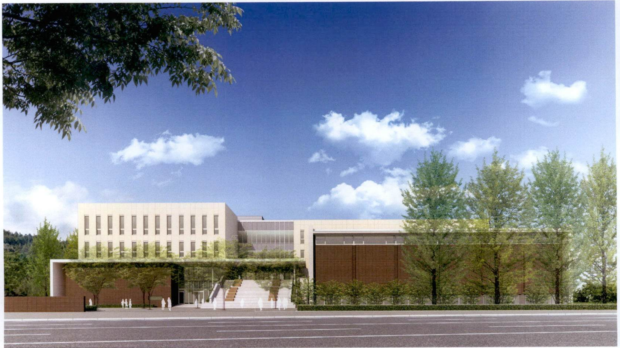
完成予想図 設計者 清水建設株式会社 戸塚 祐造