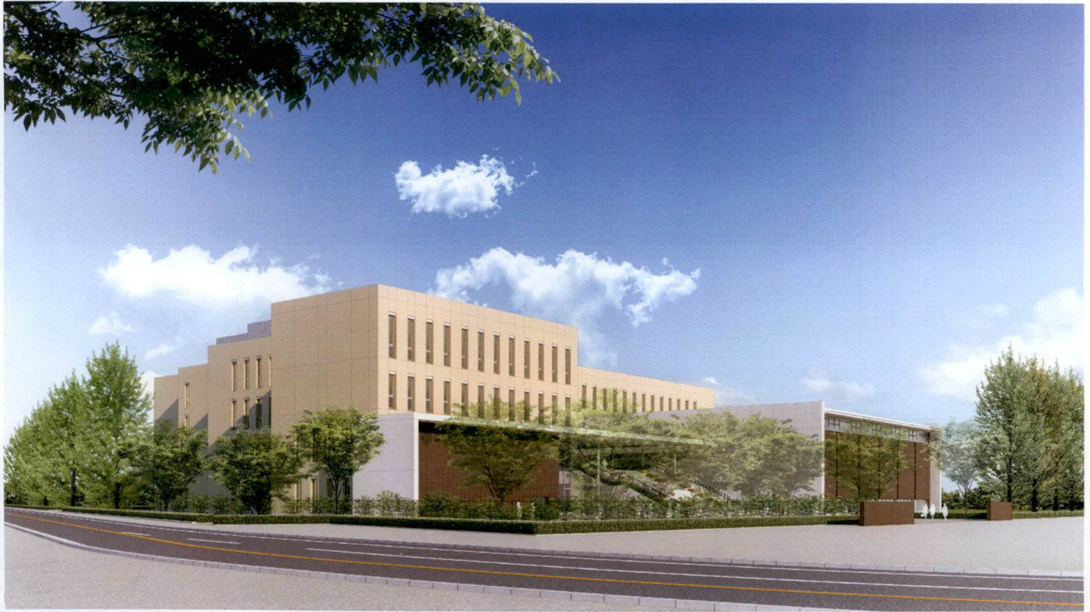
完成予想図 設計者 清水建設株式会社 戸塚 祐造