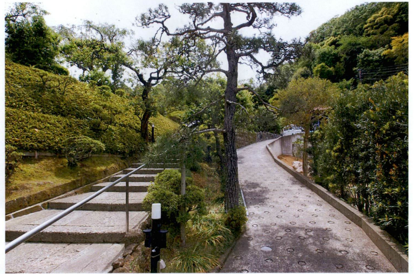
アプローチ階段部分