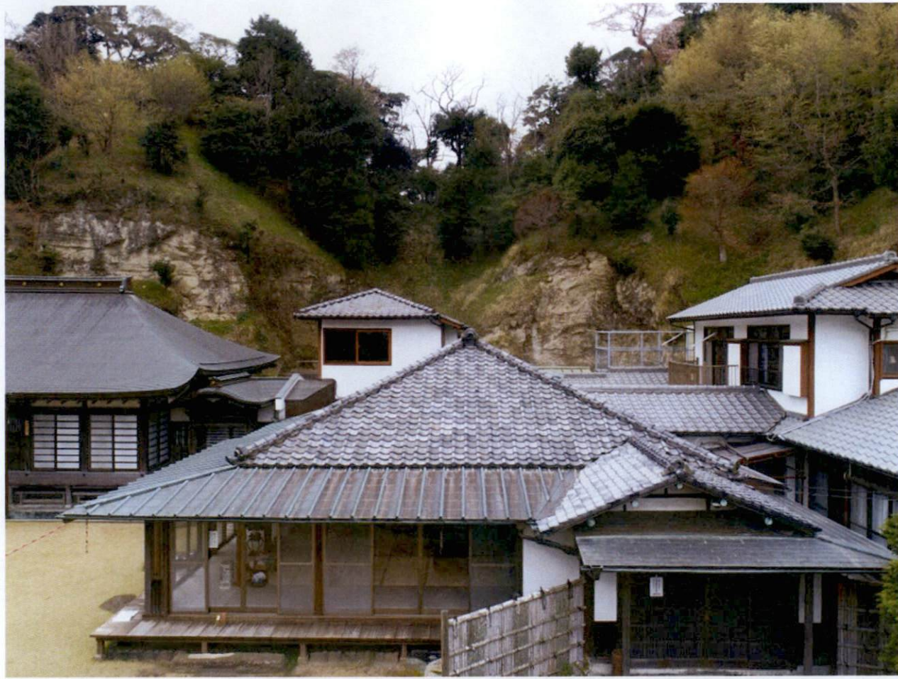
禅居院様既存客殿（大正7年新築） ※写真正面建物