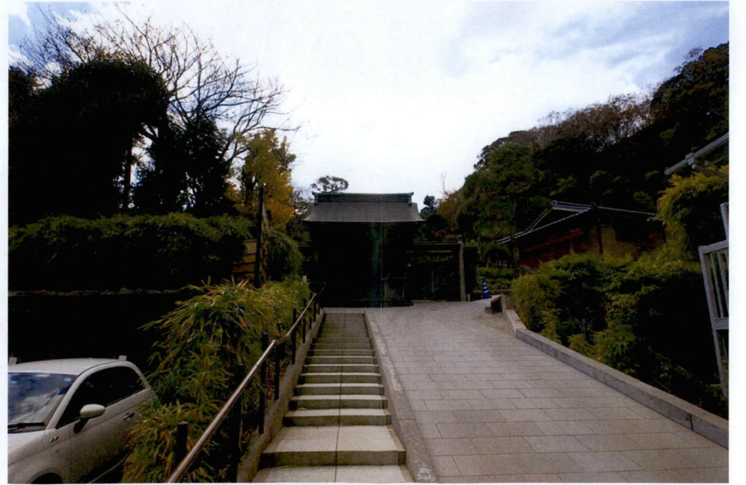
道路からアプローチ部分