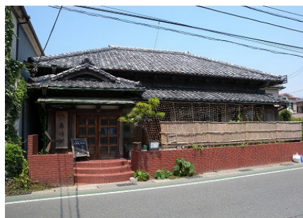
昔の材木座を今に伝える町屋/ ゲストハウス亀時間