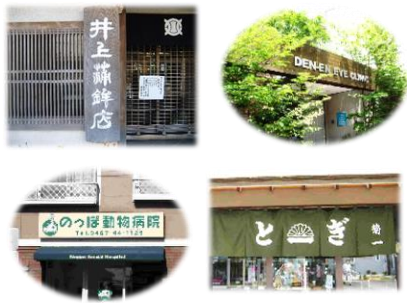
平成21年 景観づくり賞 「素敵なかんぱん」