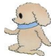
Ochibi Moyoco Anno/Cork