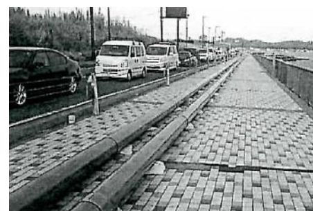
仮設の送水管の設置状況