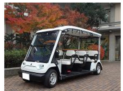
《グリーンスローモビリティ》