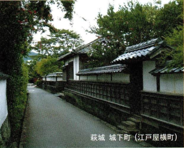
萩城 城下町 (江戸屋横町)