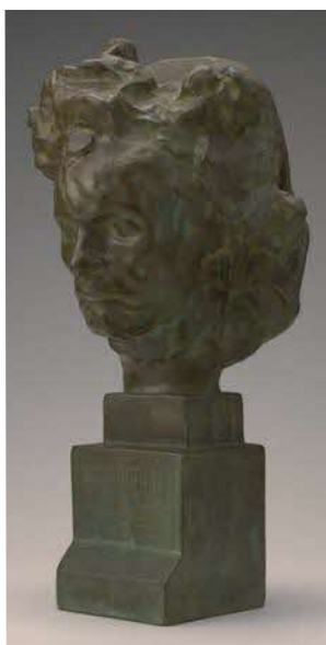
《ヴェートーヴェン》プーデル ブロンズ