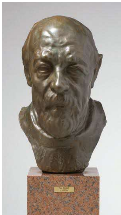
《ポール・シニャック》1961年 ブロンズ 制作地:東京