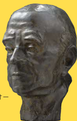
ジョルジュ・ルオー