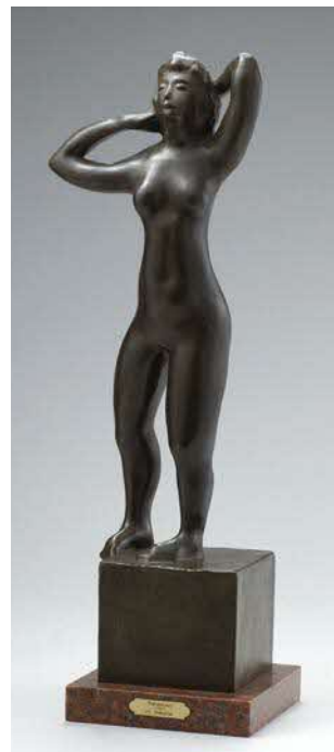
《踊り子》1957年 ブロンズ 制作地:パリ