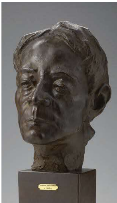
《秋原朔太郎》1973年 ブロンズ 制作地:鎌倉