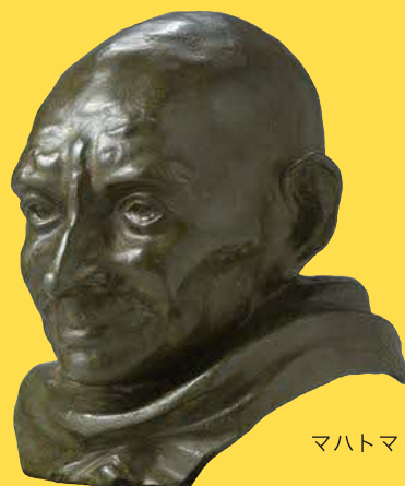
マハトマ・ガンジー