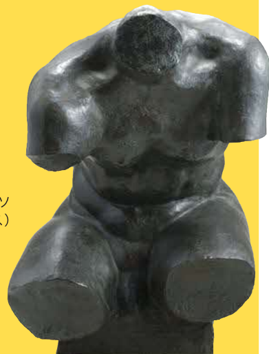
男のトルソ (ヘラクレス)