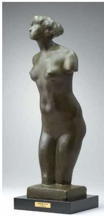
《女のトルソ》1976年 ブロンズ 制作地:鎌倉