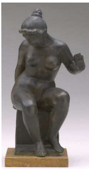
《裸婦レダ》マイヨール ブロンズ