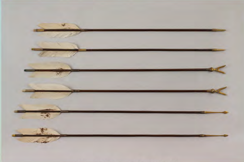
国宝 黒漆矢 (鶴岡八幡宮)

新年の鎌倉国宝館は、年の初めを寿ぐ展示で皆さまをおむかえいたします。 令和7年(2025)はへび年、干支では乙巳(きのとみ/いつし)の年にあたります。 本展では、おめでたい縁起物、十二支や七福神に関するもの、過去の乙巳年に 起こった出来事を記した史料など、約30点の作品を出陳いたします。 鎌倉の社寺への初詣とともに、新たな年を迎えるにふさわしい展示をお楽しみください。