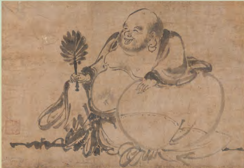
布袋図 (鎌倉国宝館)