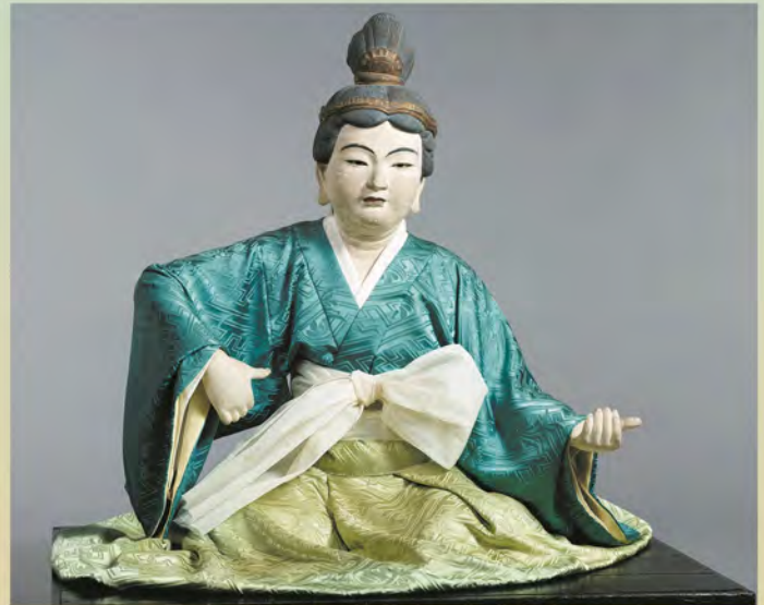
重要文化財 弁才天坐像 (鶴岡八幡宮)