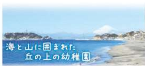
海と山に囲まれた丘の上の幼稚園