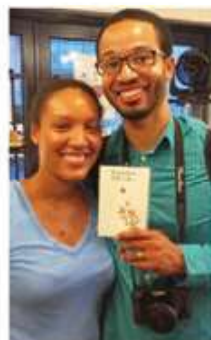
外国人が注目する 世界有数の歴史文化

印章は、国家・団体・法人・個人がお互いの「意思」や「責任」を確認し合う日本人にとって「信用」を示す大切な必需品であり西暦701年大宝律令の「天皇御璽」から脈々と受け継いできた文化でもあります