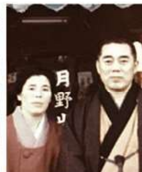
初代創業者夫婦 創業70年