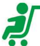
チャイルドコーナー有 ベビーカーで診療室入室可