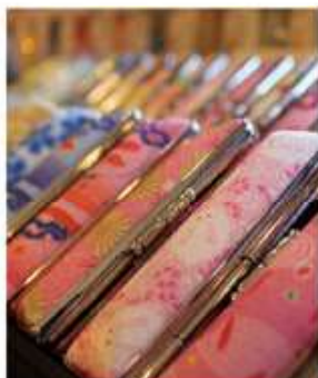
結婚、出産、契約、遺言、相続 生涯に寄り添う大切な印章