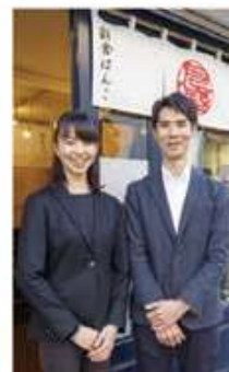
現在の三代目 夫婦 国家 技能資格保有