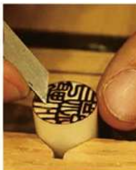
全ての工程は店内で行い 丁寧に一本一本を彫刻