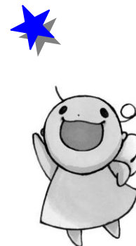
大船子育て支援センター