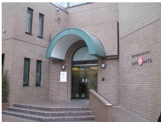
ティアラかまくら