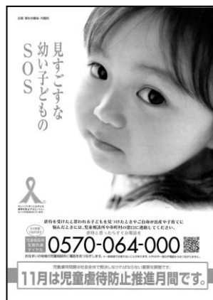
<児童虐待防止推進月間PRポスター>

発達障害を含む特別な支援が必要な子どもの早期発見と支援を目的として市内公立保育園、民間保育園、幼稚園のうち9園で実施しました。