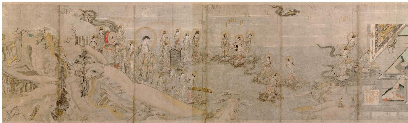
当麻曼荼羅縁起絵巻（巻下） 国宝 光明寺蔵 鎌倉時代 縦 51.5×横 96.7cm

奈良・当麻寺の本尊である、綴織当麻曼荼羅（8世紀・唐時代）の織成伝説を語る絵巻です。仏法に篤く帰依した中將姫は、阿弥陀如来に一目出会うため、蓮糸を紡いで染め上げ、まばゆい浄土の様子をあらわした大きな曼荼羅を織り上げました。姫君の願いが果たされ、阿弥陀聖衆らに迎接される巻末の光景は、観るものに希望を与える至高のシーンです。