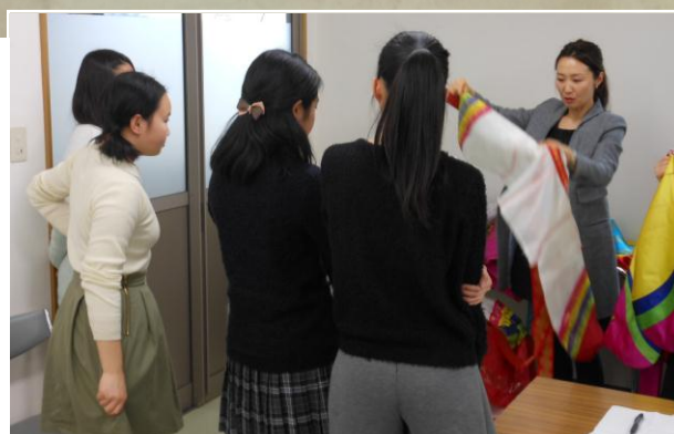
衣装を選ぶ目つきは真剣そのもの