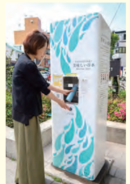
鎌倉駅西口駅前広場の給水スポット