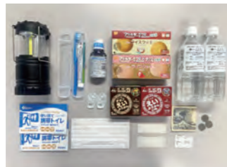
非常用持出袋の中身の例▶

●避難の場合…すぐに持ち出せる場所に、 非常用持出袋 （リュックなど）の準備を。水を入れておくことも忘れずに！