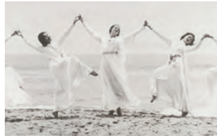
七里ヶ浜の海浜で踊るパヴロバ(中央)