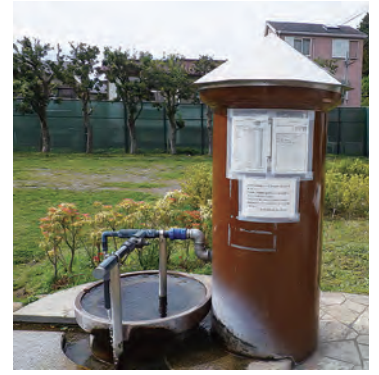
岩瀬下関防災公園の井戸