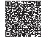
防災・安全情報メール