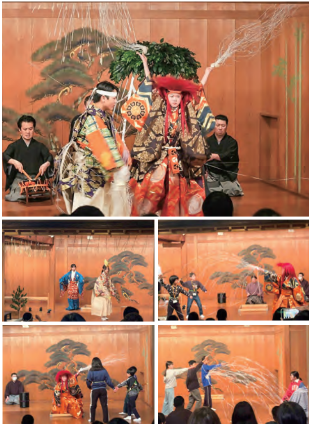
前回の発表会(上)と稽古の様子