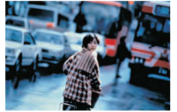
『Love Letter』

刺青一代▷6/2(土)・7(日)…10:30、3(水)・5(金)…14:00 愛のコリーダ (R18+)▷6/2(土)…14:00、4(水)・5(金)…10:30 裸の島▷6/3(土)・6(土)…10:30、4(水)・7(日)…14:00 Love Letter▷6/9(土)・12(金)…10:30、10(水)・13(土)…14:00 (ハル)▷6/9(土)・12(金)…14:00、11(水)・14(日)…10:30 ロスト・イン・トランスレーション▷6/10(水)・13(土)…10:30、11(水)・★14(日)…14:00 (★上映解説あり)