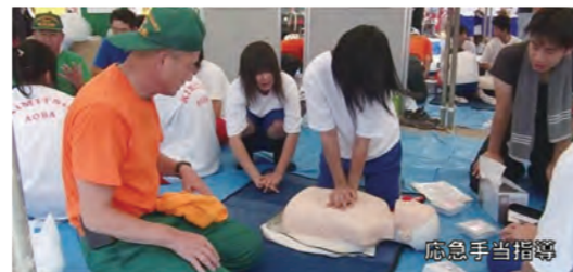
応急手当指導をする防災士

災害時に、自分や家族を守る「自助」、地域で助け合う「共助」、行政などと連携する「協働」を基本に、防災・減災に関する一定の知識と技能を身に付け、NPO日本防災士機構に認証された地域防災の担い手となる人です。