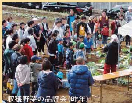
収穫野菜の品評会(昨年)

生のお子さんがいる家族。参加費は1家族千円(傷害保険料など)。定員30組。抽選。