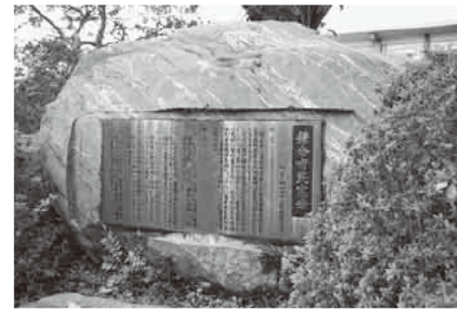
鎌倉市役所前バス停脇にある「鎌倉市民憲章」の石碑

日本文化の創造に寄与してきた鎌倉は、豊かな歴史的遺産と自然環境に恵まれ、わが国唯一の海を持つ古都です。この鎌倉がさらに高度の文化都市として発展し、よりよい鎌倉を築くための基本的理念として、昭和48年11月3日に制定されました。 制定にあたっては、文案を一般公募し、アンケート調査