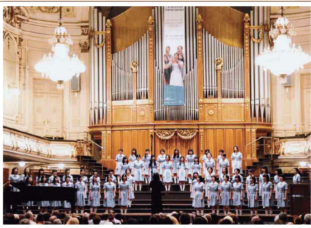
合唱の国際大会で優勝した清泉女学院高校音楽部(オーストリア・グラーツにて)