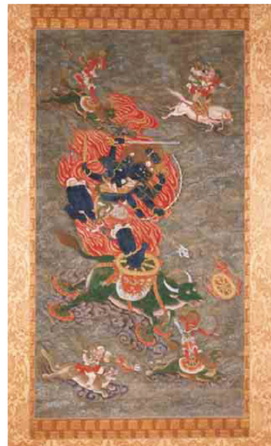
大威徳明王像(神武寺蔵)

◆毎年好評の特別展「仏像入門」を今年も開催します。普段、仏像は社寺のお堂の奥にあるため、その姿を近くで見ることが多くありません。そこで本展では、仏像の世界をより身近に感じていただくため、その姿や意味、さらには材料にまで注目して、「みほとけ」の見方をひもときます。