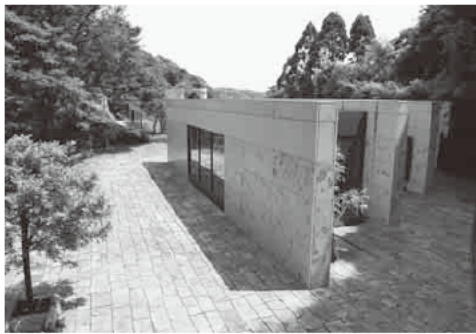
扇ガ谷一丁目用地の外観

この扇ガ谷一丁目土地・建物は、今年3月に「鎌倉市の文化財保護及び世界遺産登録に向けた取り組みに活用し、鎌倉市の教育文化の向上・発展に寄与するため」として、センチユリー文化財団などから寄付されたものです(一部市が買い取り)。土地は約1