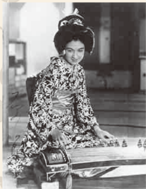
映画「新しき土」ポトレイト(原節子直筆サイン入り)