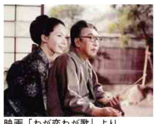
映画「わが恋わが歌」より