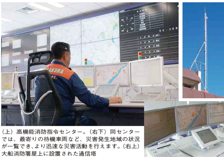
(上) 高機能消防指令センター。(右下) 同センターでは、最寄りの待機車両など、災害発生地域の状況が一覧でき、より迅速な災害活動を行えます。(右上) 大船消防署屋上に設置された通信塔

津波による消防本部機能の低下を回避するため、海に近い鎌倉消防署から内陸の大船消防署に消防本部(消防総務課、警防救急課、指令情報課、予防課)を移転します。なお、鎌倉消防署は今の場所に残ります。また、この時期に併せて台出張所を閉鎖します。配置されている救急車は大船消防署に配置換えし、併設する消防団第5分団は継続します。