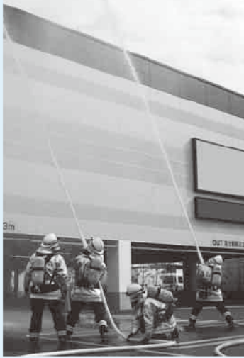
昨年の訓練 (たまや鎌倉手広店)

とき・ところ 3/6 (金) 11:00から ホテルメッツかまくら大船 (大船) *荒天時中止