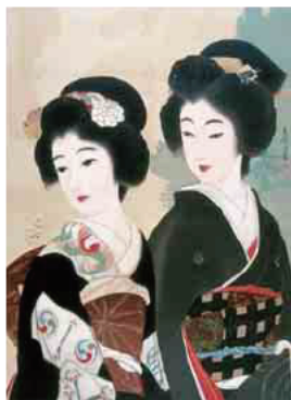
「松の内」鎌木清方・ 鯉崎英朋合作(『文藝 倶楽部』新年大附録) (大正5年)博文館

中学生と 同伴者1人の 入場が無料 になります。 ※小・中 学生向けの 解説書も配 布します。 ◆春休み子ども参加プログラ ム「絵絹に日本画材で描い てみよう!」 鎌木清方の筆遣いを観察し た後、日本画の画材で、絹を 張った色紙に絵を描きます。 対象：小・中学生、高校生と 同伴者1人(ワークショップ プでの説明は小・中学生が 対象) 定員：先着24人(各12人程度) ※参加希望者は描きたいもの の写真などを持参 とき：4月2日 (木)・3日(金) で希望する1日 午前9時30分～11 時30分 参加費：1人1,300 円(材料費込み) 申し込み：2月27 日、午前9時から 電話か当館窓口へ ※鎌倉駅地下道「ギ ャラリー50」で参 加者の作品展示を 予定しています