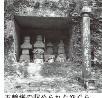
五輪塔の収められたやぐら。右脇は景時没800年忌の供養塔

私は、幼稚園の園舎の建て替えの際に発掘調査が行われ、予定通り園舎が新築されるかヤキモキしたことが