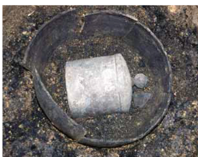
発掘された大甕の中の経筒

ふたの片口鉢と甕の上部は割れて内部に落ちており、中に銅製の経筒が横向きに埋まっています。経筒は直径約24センチ×高さ約31センチの筒形で、宝珠型をつまみのついたふたがあり、中から経軸と考えら