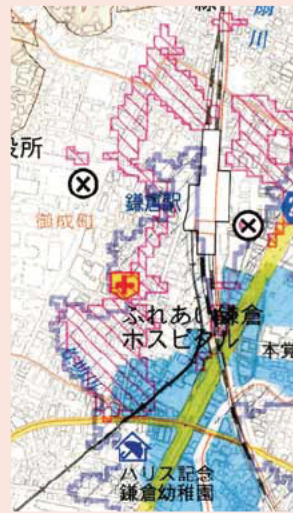
地区別危険箇所マップのイメージ

昨年、避難勧告を発令した際、市民の皆さんから「自分が避難の対象かどうかわからない」という意見が多く上がりました。そこで、土砂災害警戒区域、洪水・内水による浸水想定区域、津波浸水想定区域などの情報を現行のハザードマップより拡大した地区別危険箇所マップの暫定版を8月上旬に市ホームページに掲載する予定です。また、最新の情報を網羅したものを来年3月ごろに全戸配布する予定です。