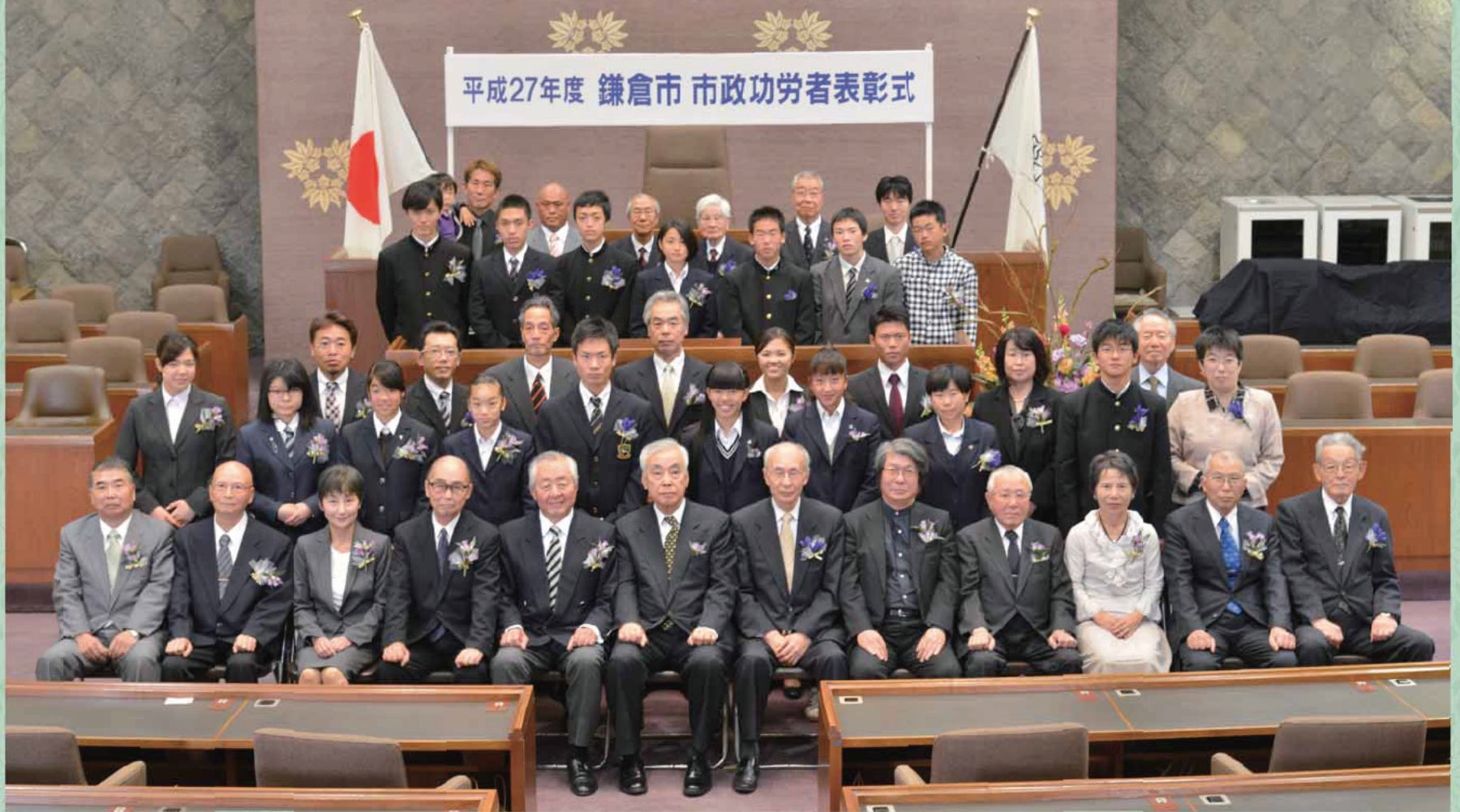
平成27年度 鎌倉市 市政功労者表彰式