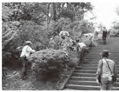
幅広い緑化活動を展開

緑を保全・創造し、質の高い快適な緑の環境づくりを進める「鎌倉みどりのレンジャー」を紹介します。 同じ古都である京都・奈良にはなくて、鎌倉にあるものなあに? 「道端の木の名前は?」「公園脇の丘の草刈りをしたら、子どもたちの遊び場になる?」など、緑に関する疑問を解決する一歩を踏み出しましょう!