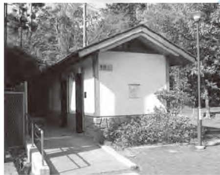
改修後の公衆トイレ(寿福寺境内)

老朽化の進んでいる社寺境内の公衆トイレのユニバーサルデザイン化を図るなど、市街地の環境整備を進めます。