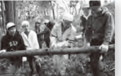
中学生への啓発活動