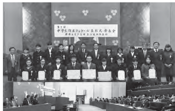
入賞作品表彰式・発表会 (1/24開催)

るだろう。つまり自然を適切に保全することは、歴史を守ることに繋がる。いわば両輪なのだ。どちらか一方が欠けても「共存」はできない。