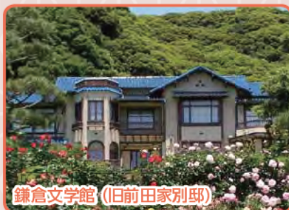
鎌倉文学館(旧前田家別邸)