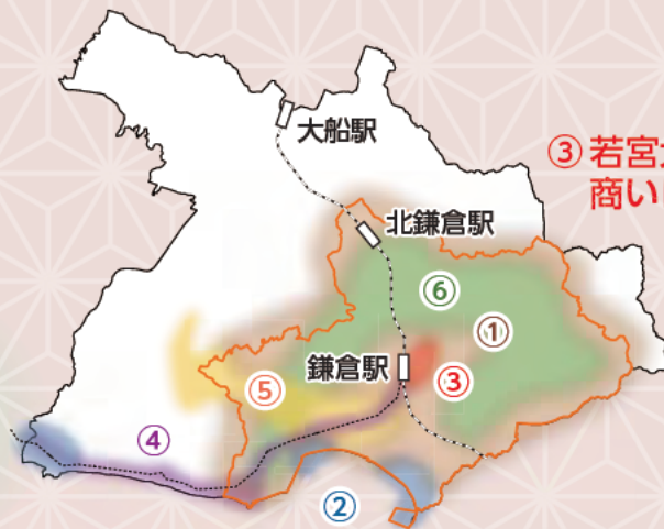
—：重点区域（詳しくは2面へ）

歴史的遺産と自然的環境が一体化して歴史的風土を形成し、多くの人々が緑地の保全に携わっています。