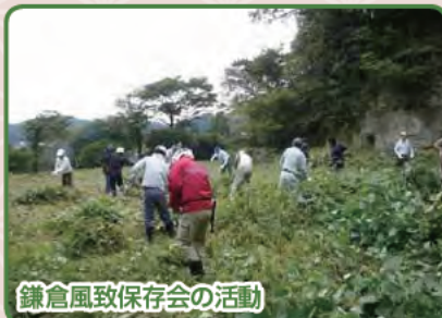
鎌倉風致保存会の活動