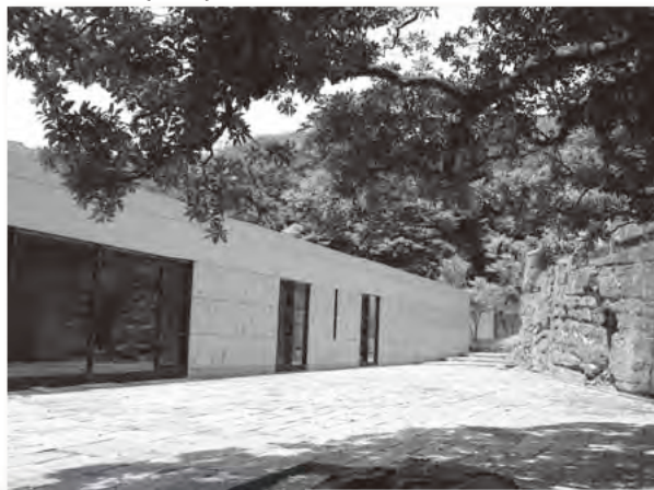
整備予定の(仮称)鎌倉歴史文化交流センター