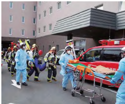
昨年の春季火災予防運動総合訓練 (ホテルメッツかまくら大船)