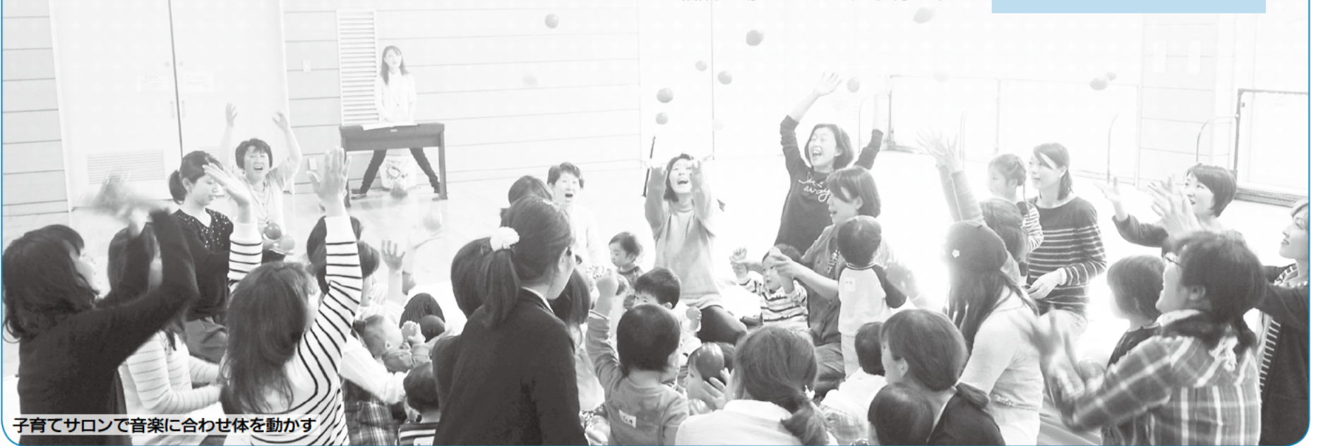
子育てサロンで音楽に合わせ体を動かす

お近くの民生委員・児童委員をご紹介します。民生委員・児童委員には法に基づく守秘義務があり、相談内容の秘密は守られます。