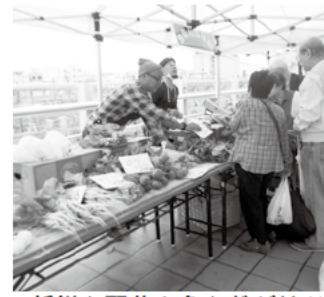
新鮮な野菜や魚などが並ぶ

市内の農・海産物やその加工品などの即売会を開催します。7月30日(土)：大船駅西口ペデストリアンデッキ 午前10時～正午(品物が無くなり次第、終了) 荒天中止 圃産業振興課(内線2481)