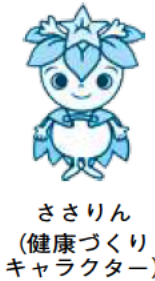
ささりん(健康づくりキャラクター) キャラクター

市では、生涯にわたる市民の健康づくりの指針・行動計画となる「鎌倉市健康づくり計画」を3月に策定しました。食生活・栄養、身体活動・運動など7つの分野について、各ライフステージでの行動目標と取り組み案を示しました。市民健康課(本庁舎1階)、支所、図書館、ホームページでご覧になれます。 圃産業年金課☎61局3943