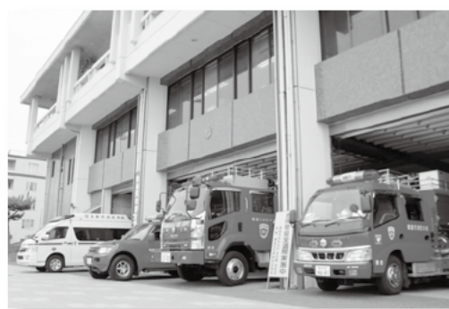
はしご車・消防車・救急車などが見学できます

とき：7月23日(土)・24日(日) 午前9時～正午 ところ：鎌倉消防署 ※はしご車乗車体験は午前9時から乗車券を配布。抽選※車での来場はご遠慮を※荒天や災害発生により、中止または内容を変更する場合は、消防テレホンサービス(☎0120・24・0467)でお知らせします ※10月15日(土)・16日(日)に大船消防署で「ふれあい広場 おおふな」を開催予定です