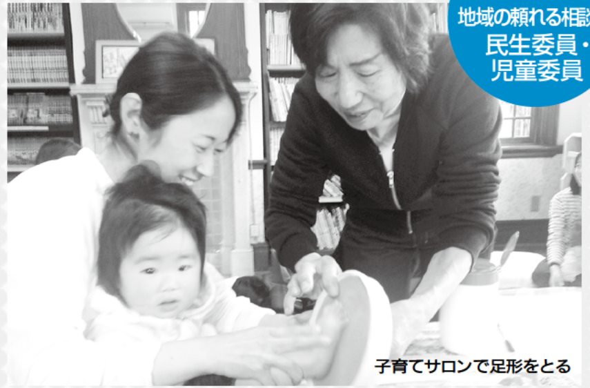
子育てサロンで足形をとる

地域の子育て家庭が必要なサービスなどを受けられるように、情報を提供したり、関係行