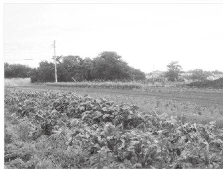
玉縄地区の豊かな農地