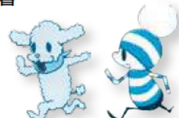
Ochibi © Moyoco Anno/Cork