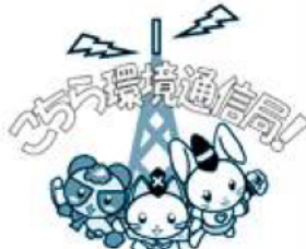
ちくわ環境通信局

中小企業退職金共済(中退共)制度は、中小企業で働く従業員のための国の退職金制度です。新規加入や掛け金を増額する場合、国から掛け金の一部が助成されます。 【市の補助制度】 市内の事業主が、中退共制度または鎌倉商工会議所が実施する特定退職金共済制度に新規加入した場合、国の助成に加え、掛け金の一部(従業員1人当たり月額400円)を加入から3年間補助します。 圃中退共本部☎03・6907局1234 産業振興課☎61局3853