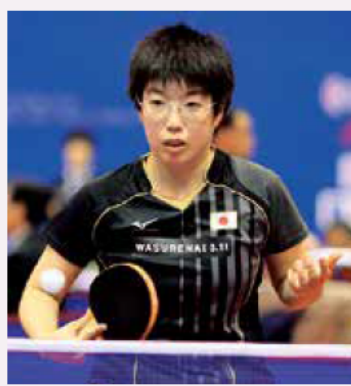
伊藤楨紀選手 (パラリンピック卓球女子)