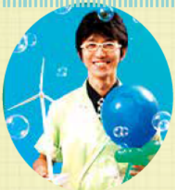
サイエンスプレゼンテーションで日本一となったらんま先生

※この事業は全国モーターボート競走施行者協議会からの拠出金を受けて実施するものです