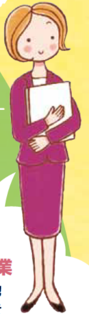
主任 ケアマネジャー

安心して日常生活を送れるように、高齢者の権利を守る取り組みを行います。例えば、成年後見制度の紹介や虐待の早期発見、消費者被害の未然防止などに取り組みます。