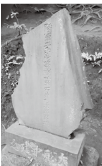
熊野神社の忠魂碑