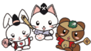
かまくら3R推進キャラクター

生ごみ処理機を使用する世帯を対象に、市役所で一部の非電動型の生ごみ処理機を市販価格の1割程度で販売しています。