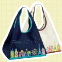
どちらかをプレゼント

※この事業は全国モーターボート競走施行者協議会からの拠出金を受けて実施するものです