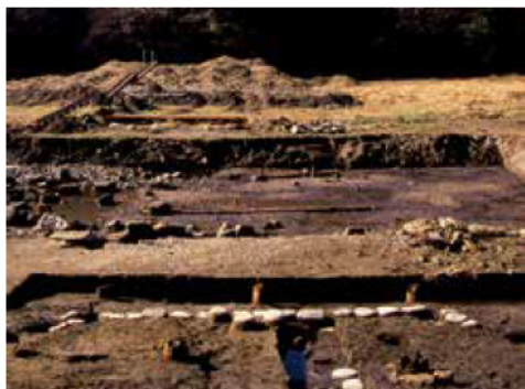
白い石が池の東側の橋のたもと。山の方向(池の西側=二階堂側)に橋が架かる

また、この掘り込みと平行する位置に長さ6.32.2.4尺、幅約35寸、厚さ25寸の、上面が平滑に加工された木材が残っていました。この材には中央と両側にほぞ穴が残っていたことから、ここに橋脚が立てられたことが分かり、平行す