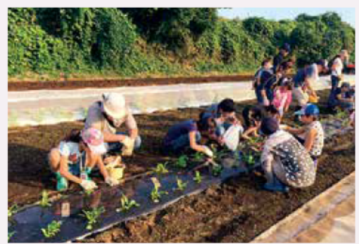
ダイコンの間引きも学ぶ(昨年)

申し込み...はがきで、催し名、代表者の住所・氏名・年齢・電話番号、参加する家族の氏名・年齢を、8/15(必着)までにJAさがみ玉縄支店内鎌倉地区運営委員会事務局(〒247-0072岡本2-17-24、☎44-3851)へ。当選者には8/26までに郵送で通知します